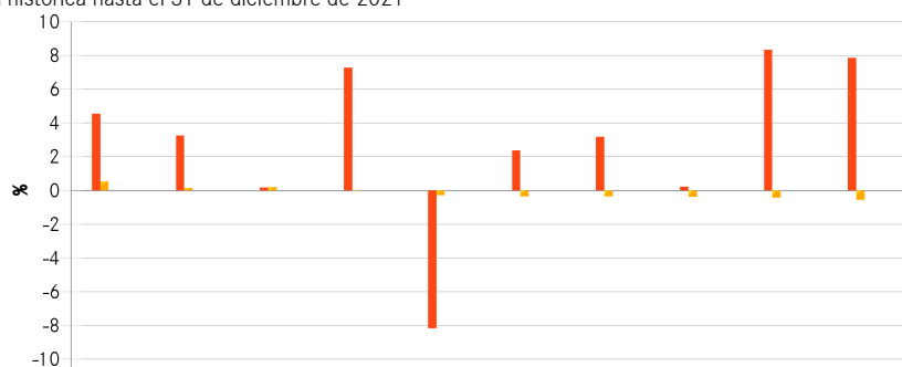
Rentabilidad histórica hasta el 31 de diciembre de 2021

Antes del 15.12.2021, el Fondo utilizaba un índice de referencia distinto, lo que se refleja en los datos del índice de referencia.